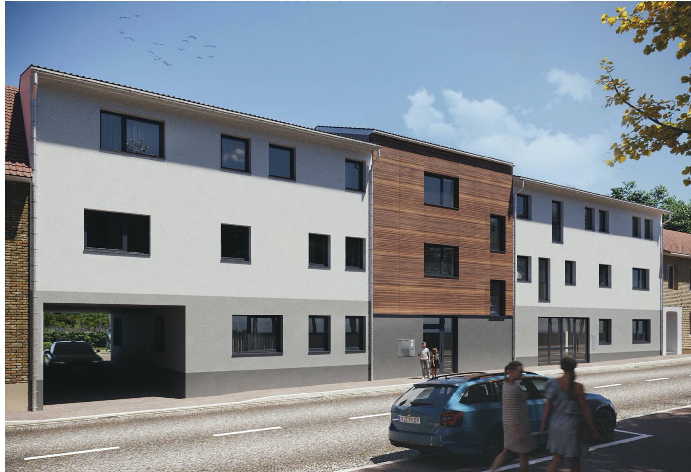
Fotos zeigen realistische 3D-Visualisierung des Gebäudes