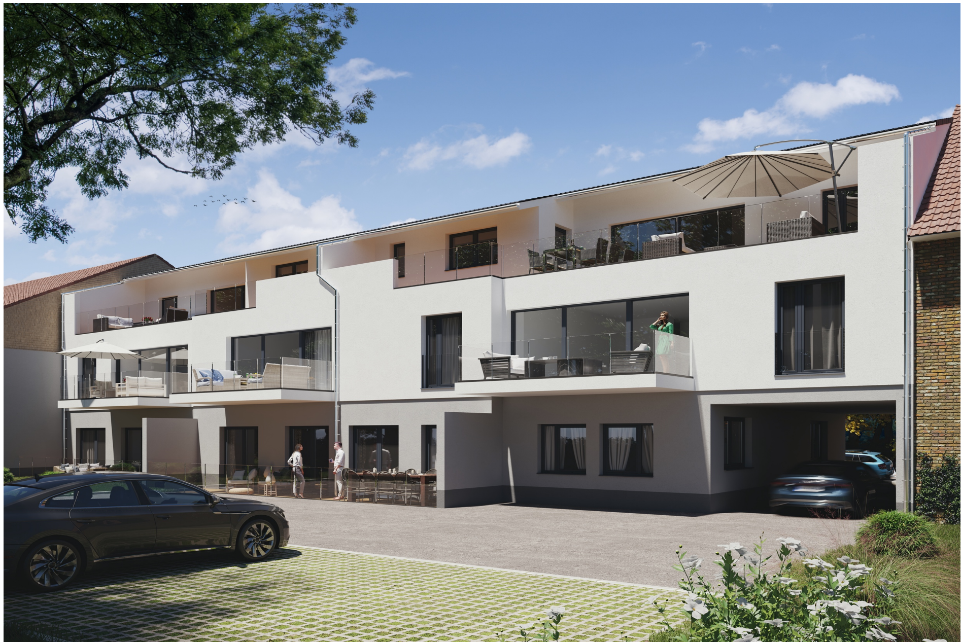
Dünzebacher Straße 11, 37269 Eschwege