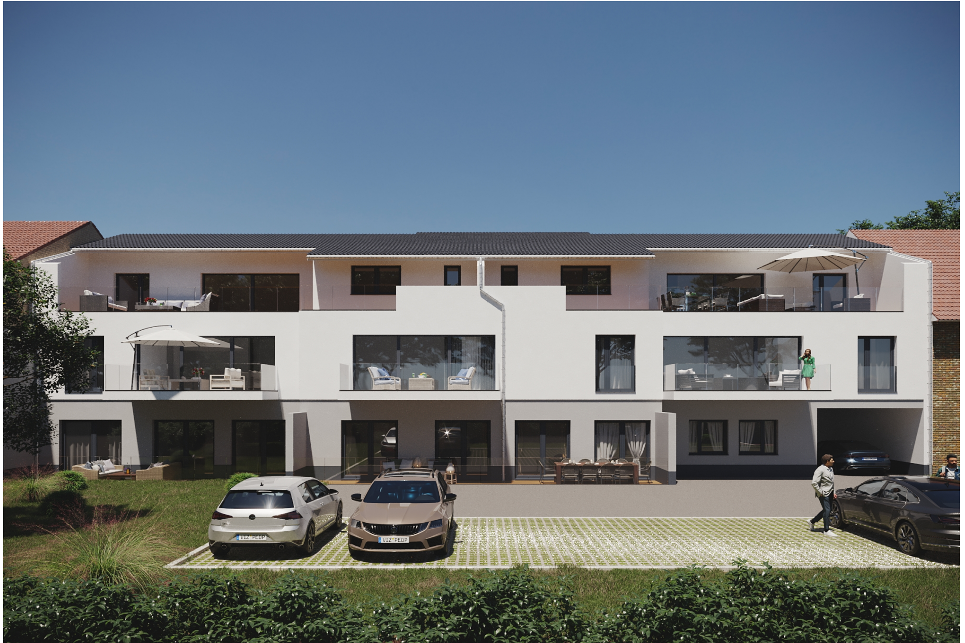
Dünzebacher Straße 11, 37269 Eschwege